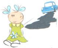
Problemy ze zrozumieniem zagrożenia