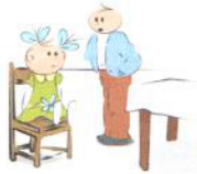
Zaburzony kontakt wzrokowy (unikanie, krótkotrwały lub wręcz przeciwnie - wgapienie się)