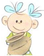
Nieadekwatne przywiązanie do przedmiotów