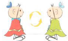
Powtarzanie słów i zdań (echolalie)