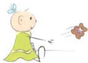
Używanie zabawek niezgodnie z przeznaczeniem

Data konsultacji 2 kwietnia 2016 godz. 9 00 - 13 00