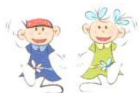
Nadmierne przywiązanie do codziennej rutyny