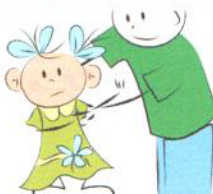
Niechęć do przytulania