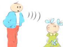
Brak reakcji na własne imię