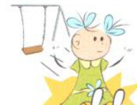
Mniejsza lub większa wrażliwość na ból