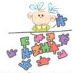
Problemy z wykonywaniem zadań, które wymagają wykorzystywania kompetencji społecznych