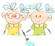
Pokazywanie przedmiotów z wykorzystaniem rąk innych osób

Data konsultacji 2 kwietnia 2016 godz. 9 00 - 13 00