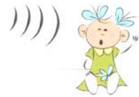
Sprawianie wrażenie głuchego